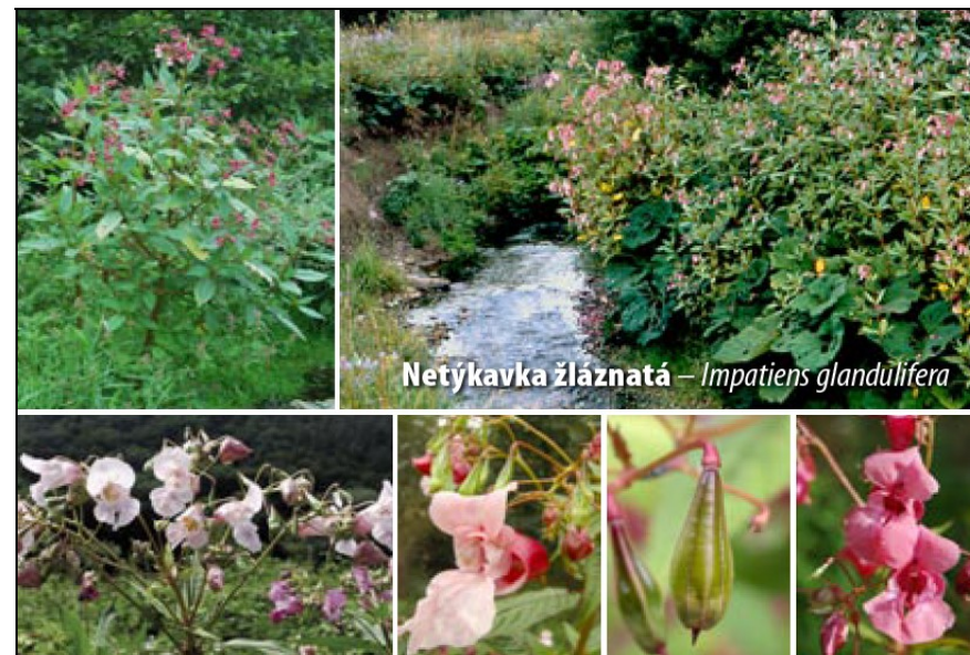
Netýkavka žláznatá – Impatiens glandulifera

Tato ztráta byla hrazena z výtěžku minulých období. Jedná se o ztrátu dočasnou, danou zálohovým financováním dvou projektů PHARE, které byly realizovány od 17.1. do 16.12.2005 a od 1.2. do 30.1.2006, jejichž náklady byly realizovány v roce 2005, ale byly zálohovány pouze 60% výše projektů. Doplatek podpory z EU tak bude zobrazen teprve v roce 2006 a zaúčtován do hospodářského výsledku tohoto roku.